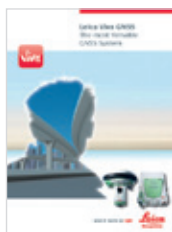
Leica Viva GNSS Broszura produktu