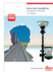
Leica Viva SmartPole Broszura produktu