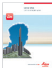
Leica Viva Broszura ogólna

Ilustracje, opisy i dane techniczne nie są wiążące i mogą ulec zmianie. Wszystkie prawa zastrzeżone. Drukowano w Polsce – Copyright Leica Geosystems AG, Heerbrugg, Szwajcaria, 2012. pl – 01.14