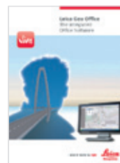
Leica Viva LGO Broszura produktu