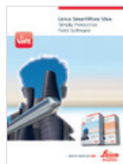
Leica SmartWorx Viva Broszura produktu